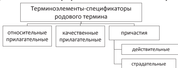
Рисунок 3 – Способы выражения терминологических спецификаторов

На рисунке 3 схематично показаны основные способы выражения терминологических спецификаторов, формирующих вторую когнитивную единицу в термине. Пополнение словаря обозначенными морфологическими разрядами слов свидетельствует о том, что неологизация происходит за счёт слов, относящихся к профессиональной языковой картине мира.