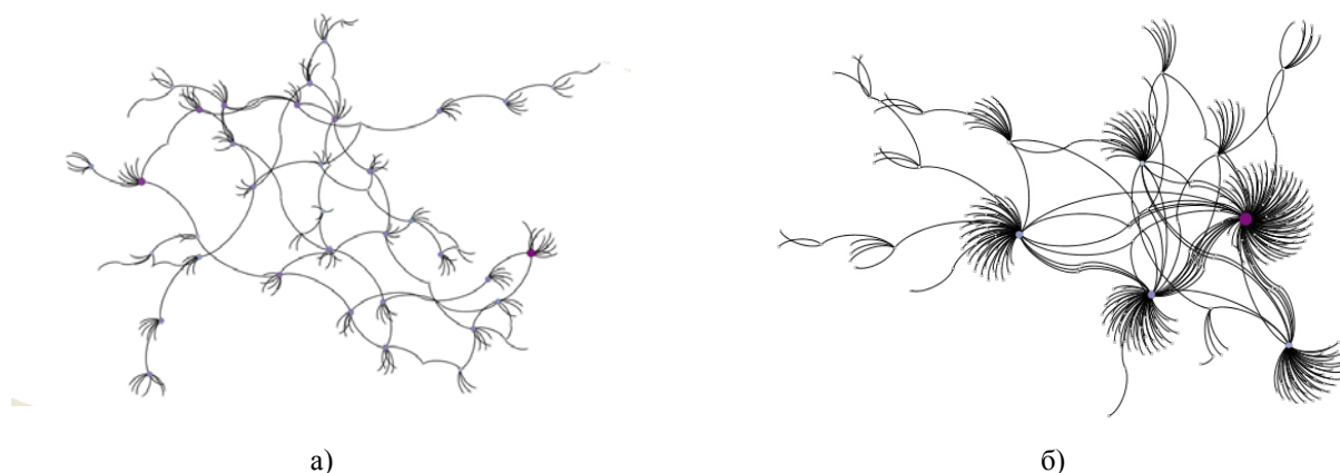
Рисунок 2 – Пример сети, построенной зондированием модельных сетей: (а) – Erdős-Rényi; (б) – Barabási-Albert

Данный алгоритм проверялся для двух самых распространенных модельных сетей Erdős-Rényi (ER) и Barabási-Albert (BA) (рисунок 2) [6, 7]. Известно, что модель ER – это случайная сеть, которая строится следующим образом: множество из N изначально не соединенных узлов попарно объединяют с вероятностью p . В результате создается сеть приблизительно с p \times N \times (N - 1) / 2 случайно выбранными связями.