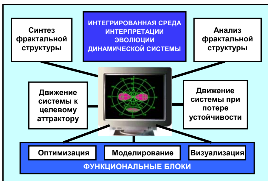
Рисунок 1 – Концептуальная модель онтологии современной теории катастроф, реализуемая в ПИЦК

Концептуальные основы создания платформы ПИЦК базируются на достижениях искусственного интеллекта (ИИ) [3]. Важная роль принадлежит принципу открытости, позволяющему обеспечить наиболее сложные уровни иерархической структуры системы – самоорганизацию и самообучение. В результате открываются возможности интерпретации процессов при анализе альтернатив и принятии решений, а также при моделировании действий системы в процессе решения задачи и «обучении» на своем опыте. На рисунке 1 приведена концептуальная схема ПИЦК, определяющая онтологические принципы функционирования системы при контроле чрезвычайных ситуаций на основе методов современной теории катастроф [4].