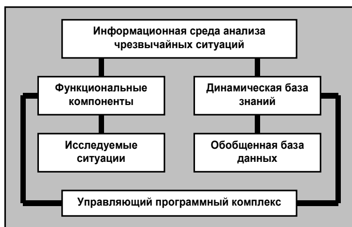
Рисунок 3 – Общая программная архитектура, определяющая онтологию информационной среды ПИЦК

Модель (1)–(5) определяет онтологию, формализующую основные информационные потоки в ПИЦК и может быть отображена на архитектуру программной системы. На рисунке 3 приведена типовая архитектура системы ПИЦК, интегрирующая информационную среду анализа чрезвычайных ситуаций. Система содержит функциональные компоненты, обеспечивающие логический вывод на основе динамической базы знаний, реализуемый под управлением программного модуля. ПИЦК предоставляет пользователю когнитивный диалоговый интерфейс, который включает в себя конструктор сценариев исполнения, посредством которого формируется входная информация для расчетов с максимальным использованием понятийной базы и справочной информации соответствующей предметной области. В состав ПИЦК входит модуль, отслеживающий и анализирующий действия оператора с целью возможной коррекции или оптимизации его действий.