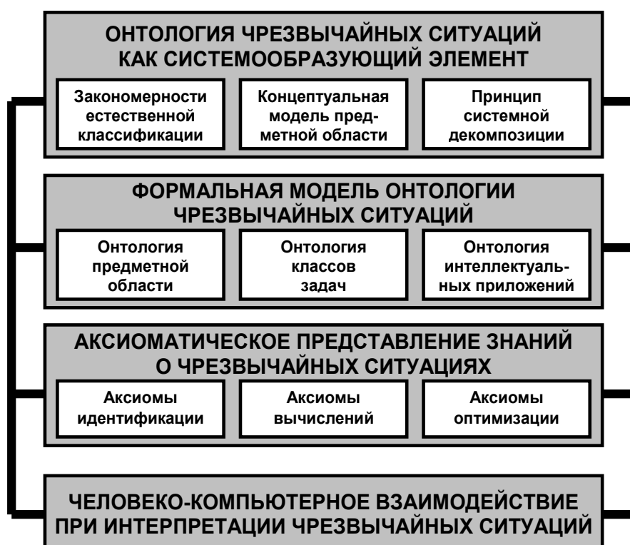
Рисунок 2 – Формальная модель онтологии чрезвычайных ситуаций, реализуемая в ПИЦК

Первые три компонента кортежа (1) являются структурами, заданными на множестве элементов S_i \in S , которые соответствуют основным компонентам программной системы. Так, S(F) = \{S_{F1}, \dots, S_{FN}\} – совокупность функциональных подсистем, определяющих основные возможности программной системы. S(M) – структурная схема системы, включающая множество M \equiv \text{Set}(S(M)) ее компонентов и имеющая собственную организацию \text{Org}(S(M)) ; S(W) – условия формирования целостной системы (цели функционирования, принципы и алгоритмы управления, качество результата решения задачи и эффективность).